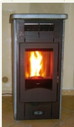
Poêle à granulés