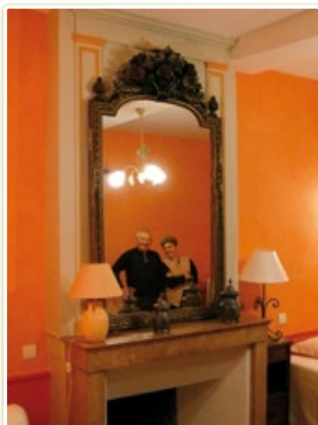
Une des chambres d'hôtes

Monsieur et Madame GELOT ont rénové une maison du XVI ème siècle pour leur habitation et trois chambres d'hôtes. Le chauffage étant à créer, ils se sont naturellement tournés vers un système simple et pratique aux granulés de bois.