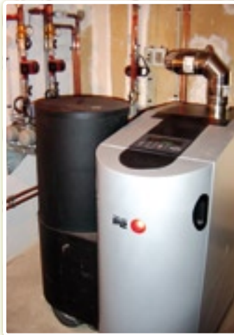
Chaudière et son mini silo (noir)