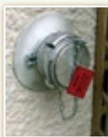
Raccord pompier pour livraison par camion souffleur