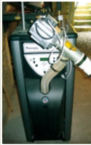
Chaudière et son alimentation automatique